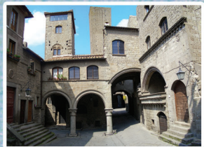
San Pellegrino - Viterbo