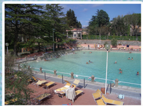
Terme dei Papi - Viterbo