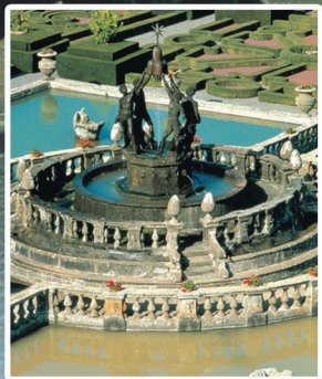
Villa Lante - Bagnaia